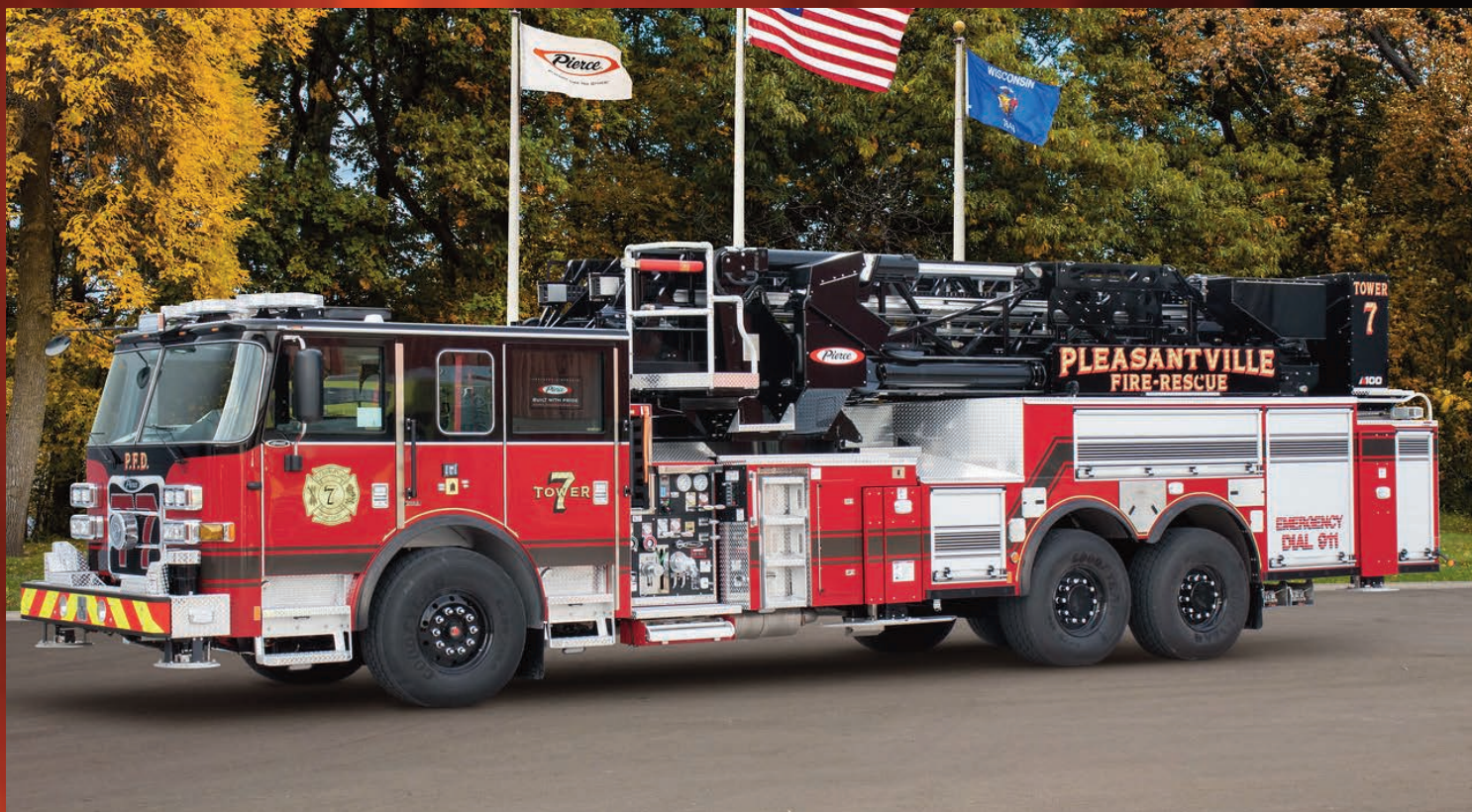
Pierce Arrow XT 100' Ascendant Mid-Mount Tower City of Pleasantville Job #34724